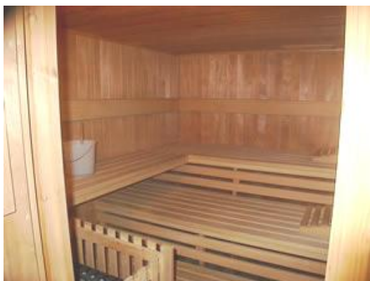
6 Personen Sauna