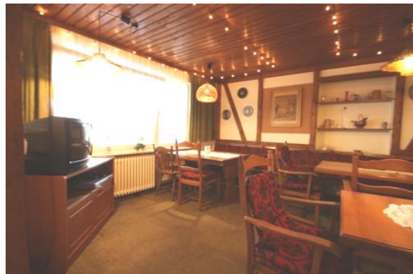
Kornkammer & TV Raum

Die beiden Räume sind zum abendlichen Feiern gedacht, inkl. Musik- und Lichanlage. Ihre Bierfässer können Sie direkt an die vorhandene Zapfanlage anschließen. Karaoke-Anlage, Würfelbecher und Karten für lustige Stunden sind vorhanden.